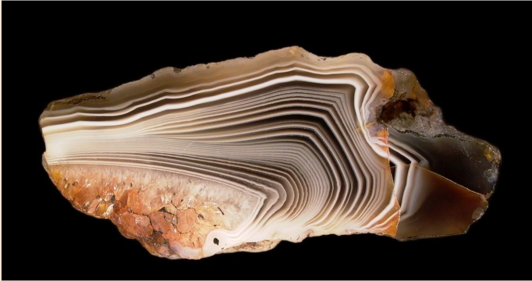
7 cm.