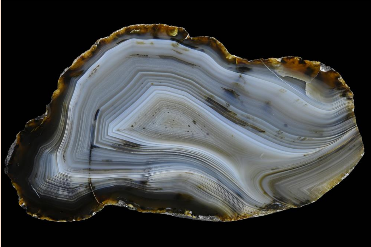
8.8 cm. Wolfgang Waeger collection & photo.