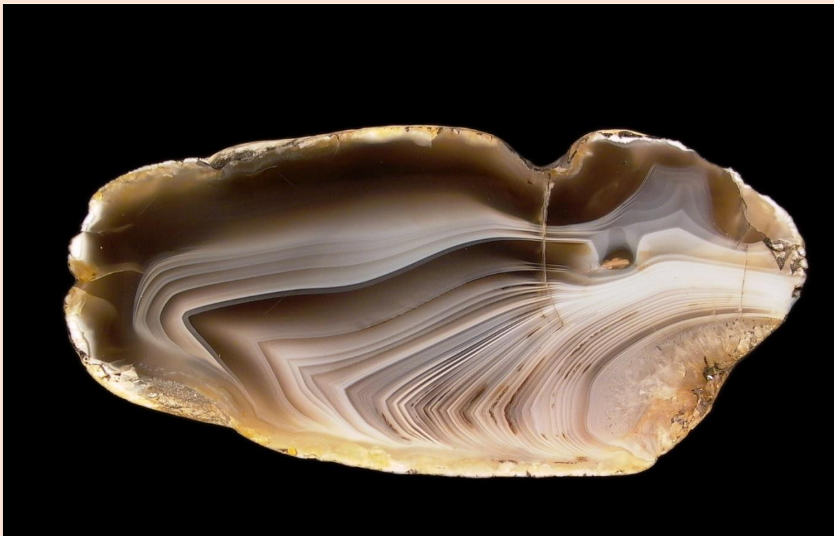
8.5 cm. Guide de Beer collection & photo.