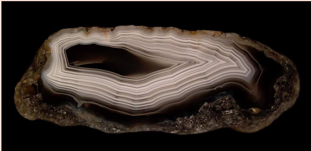
6.5 cm.