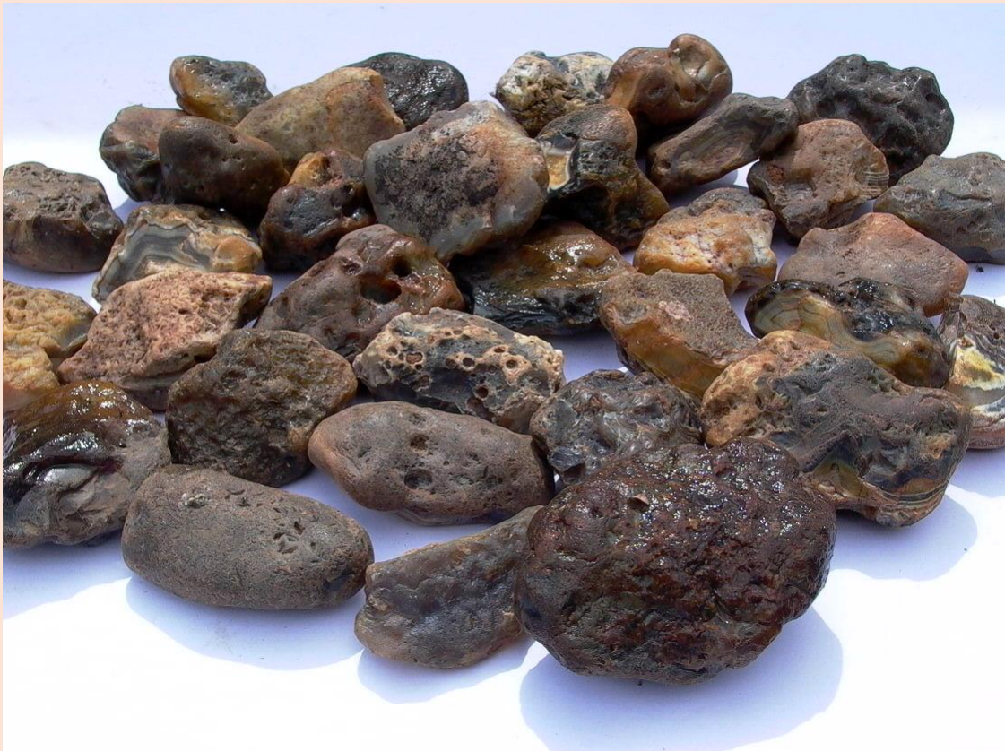
Rohachate in situ und nach der Reinigung / Agate rough in situ and after cleaning.