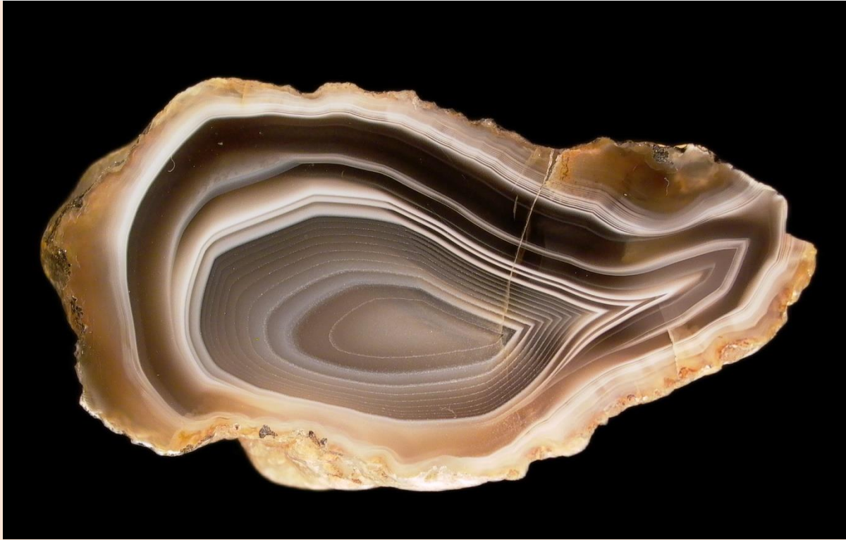
7.5 cm.