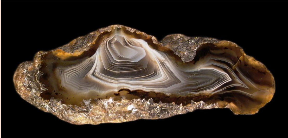
7.5 cm.