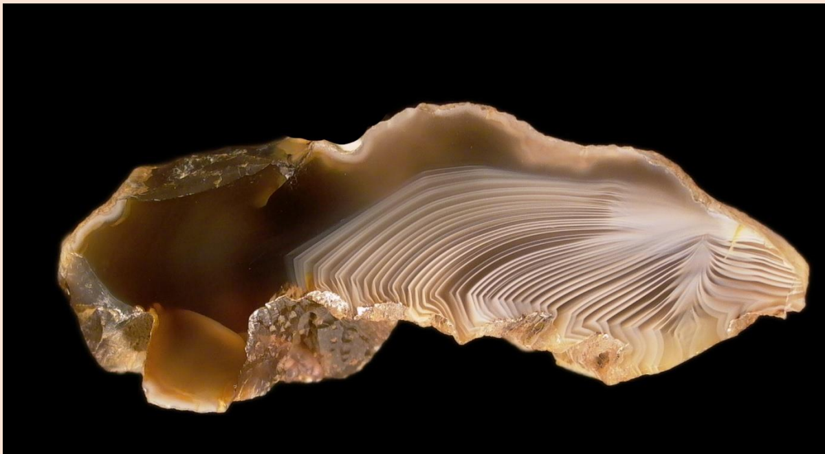
6 cm.