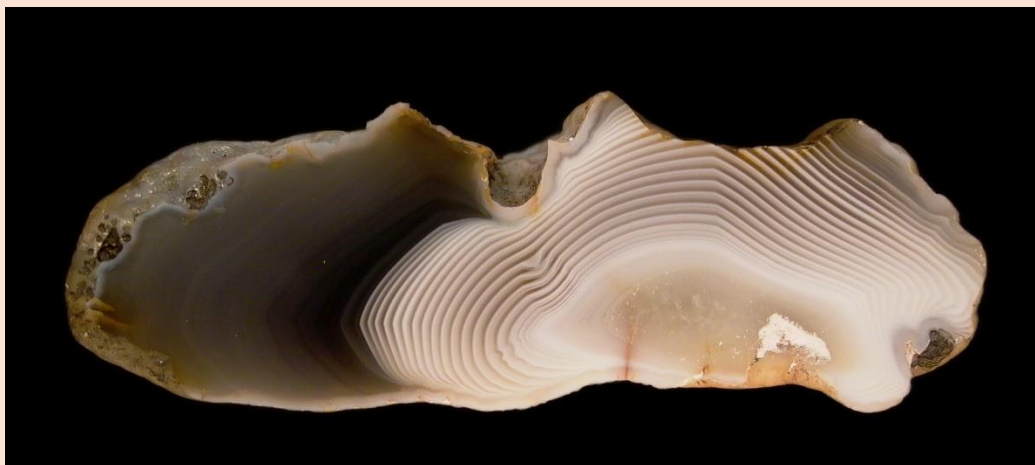
7.5 cm.