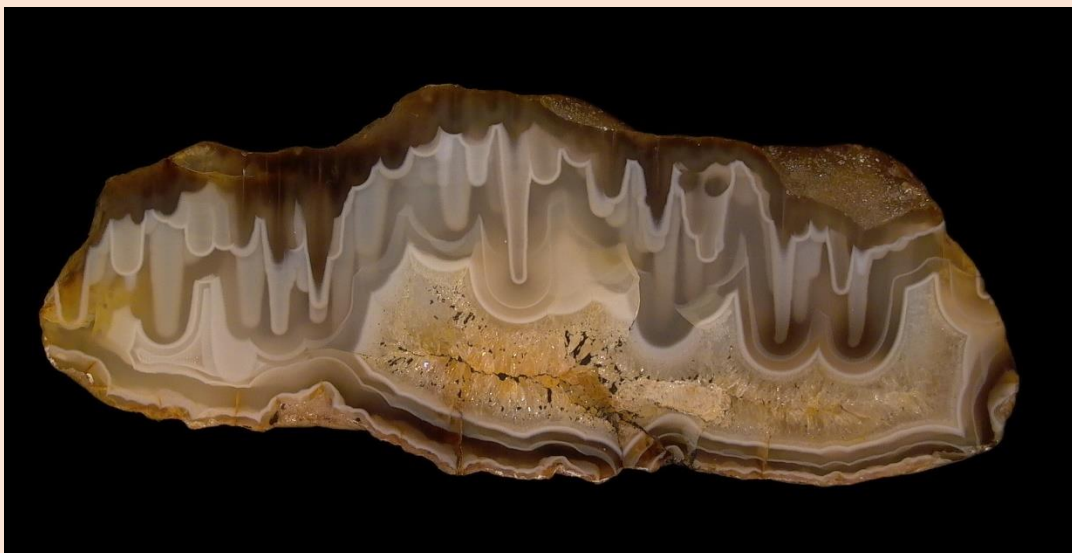
6.5 cm.