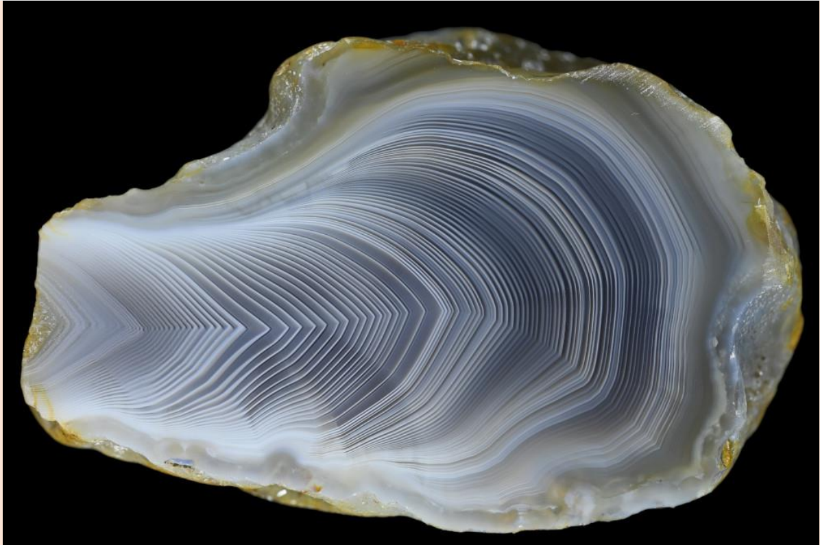
5.2 cm.