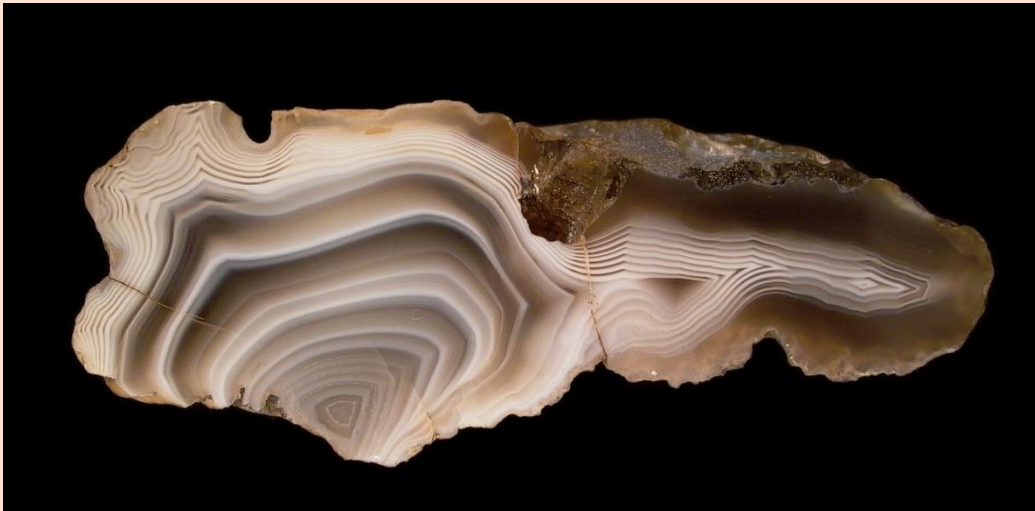
9 cm.