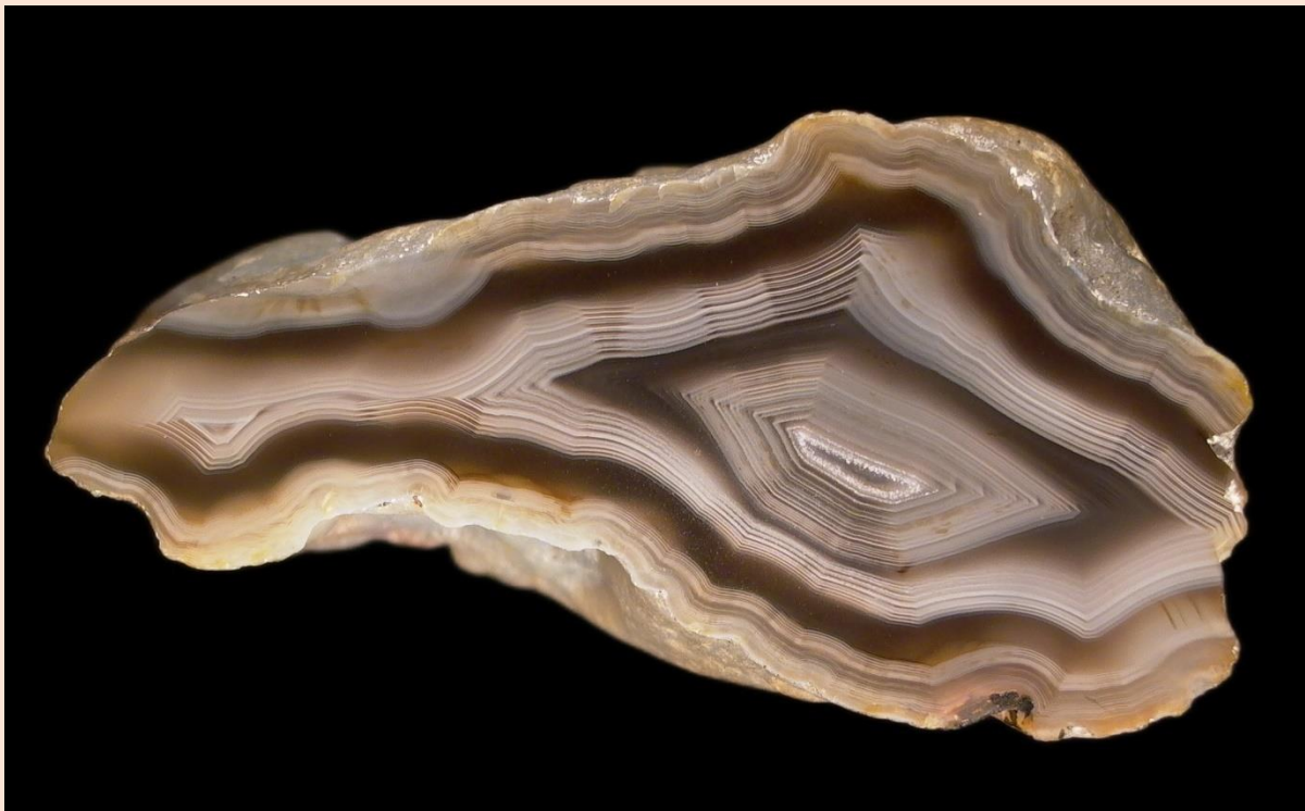
Schattenachat / Parallax phenomenon. 7 cm.